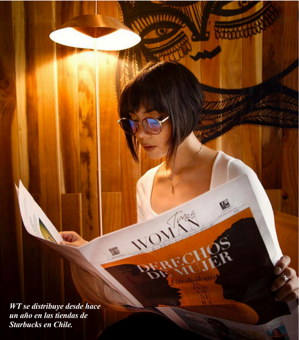
WT se distribuye desde hace un año en las tiendas de Starbucks en Chile.