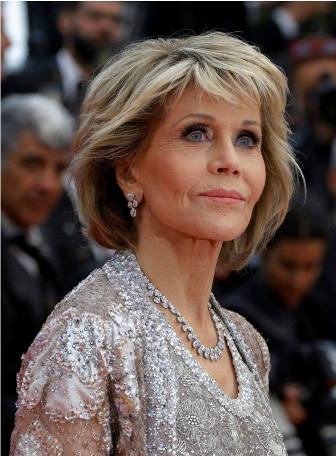
Activista implacable y rostro publicitario a su 84 años, Jane Fonda sigue sorprendiendo al apoyar con convicción causas como el cambio climático, mientras recientemente anunció el inicio de su batalla contra el cáncer.