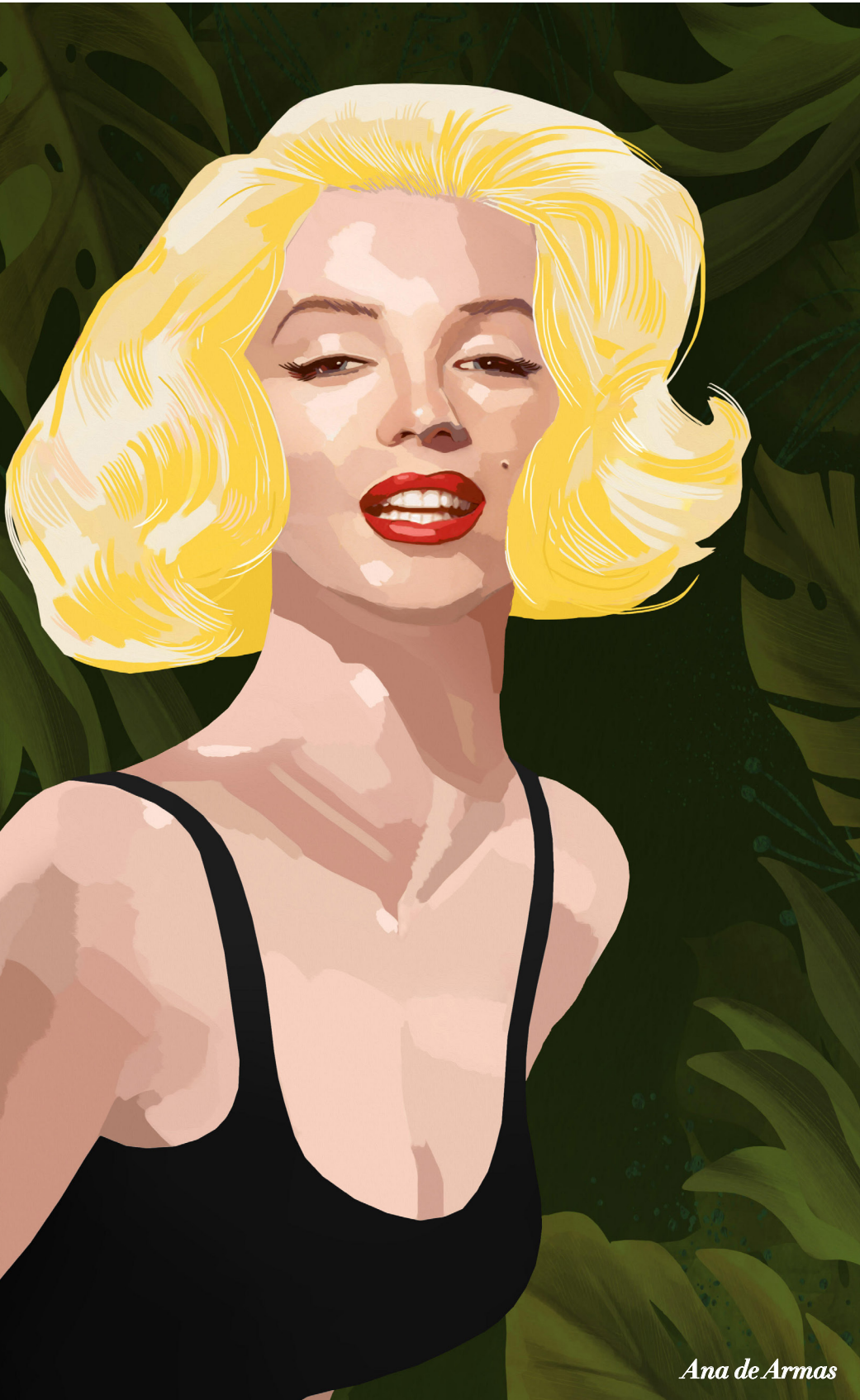
Ana de Armas

¿PUEDE UNA PELÍCULA BIOGRÁFICA AMENAZAR EL LEGADO DE UNA FIGURA HISTÓRICA? Esta pregunta se ha repetido con insistencia durante todo el año, primero tras el estreno de “Spencer” del director chileno Pablo Larraín, donde la vulnerabilidad de Lady Di quedó expuesta como nunca antes. Y ahora, tras el estreno mundial de Blonde , la cinta sobre Marilyn Monroe basada en la novela de Joyce Carol Oates que fue calificada como la más misógina del año.