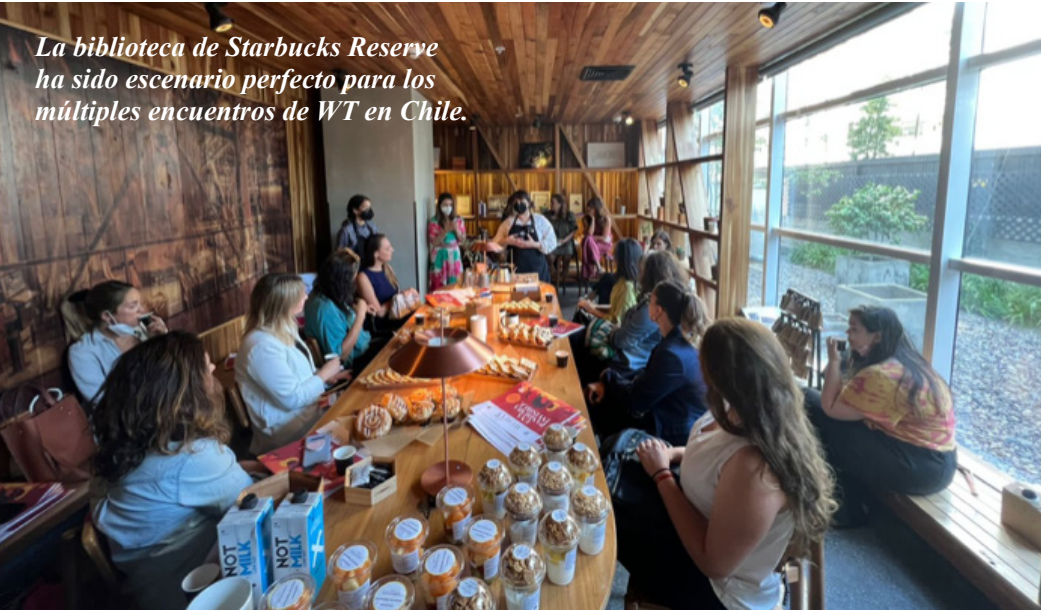
La biblioteca de Starbucks Reserve ha sido escenario perfecto para los múltiples encuentros de WT en Chile.