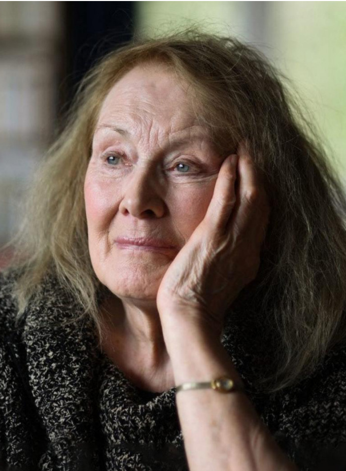
La escritora y profesora de letras modernas, la francesa Annie Ernaux, acaba de llevarse el Premio Nobel de Literatura 2022, mientras la crítica internacional define su trabajo actual como el mejor momento de su carrera.