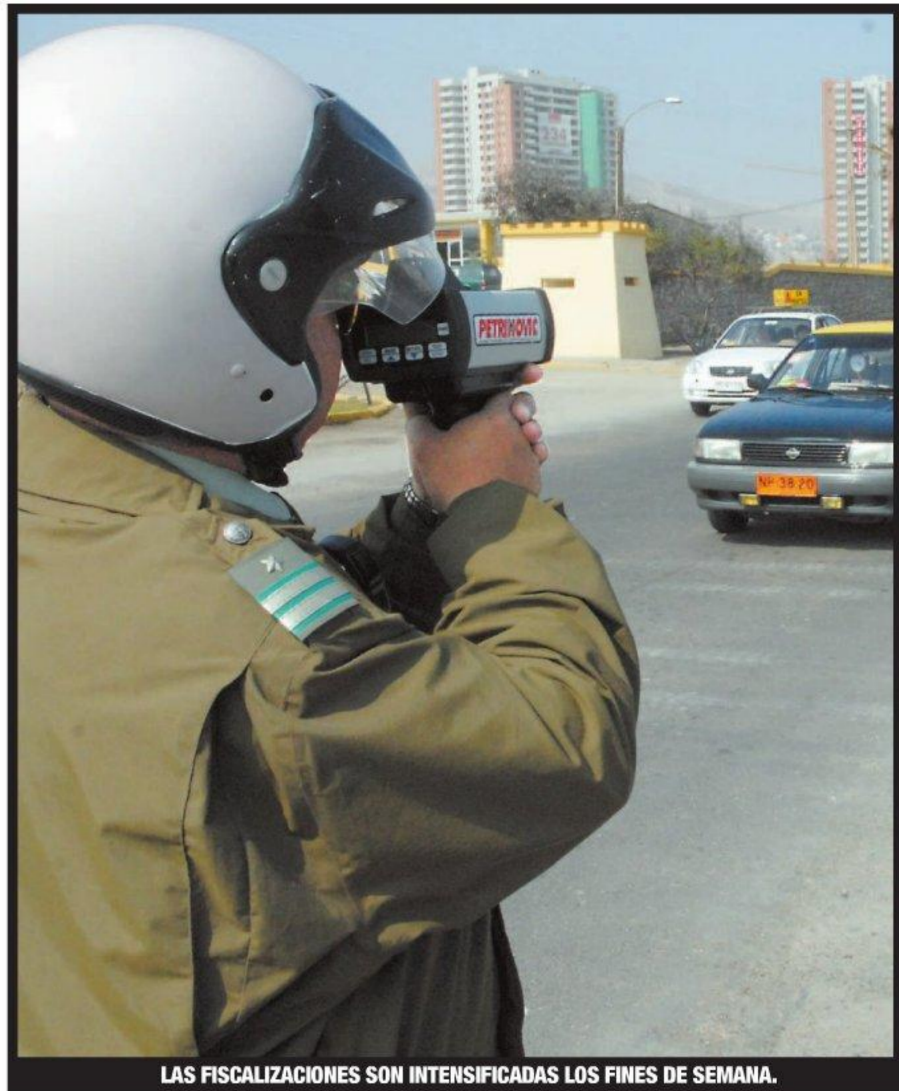
LAS FISCALIZACIONES SON INTENSIFICADAS LOS FINES DE SEMANA.

Las campañas preventivas y fiscalizaciones y controles se mantendrán durante todo el año, anunció el general.