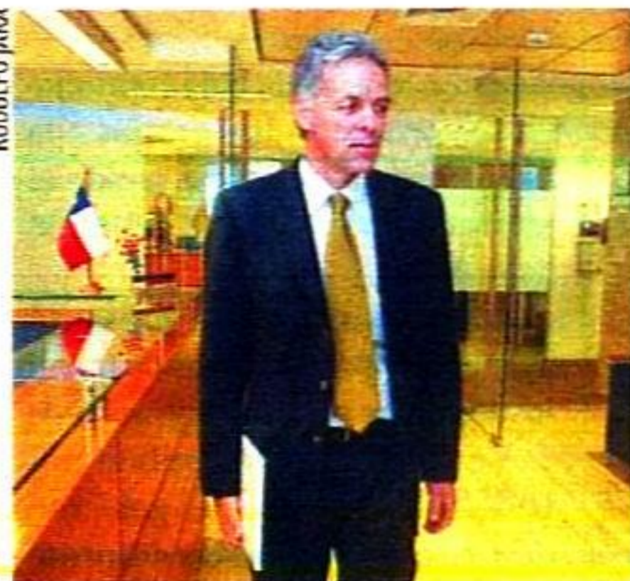
El ministro de Energía, Ricardo Raineri, detalló que posee dos inmuebles.

Las nuevas autoridades tienen 30 días de plazo desde que asumieron para presentar sus declaraciones de renta e intereses a Contraloría. Si bien el plazo vence el 12 de abril, ya comenzaron a llegar los documentos. El primero fue el del ministro de Energía, Ricardo Raineri.