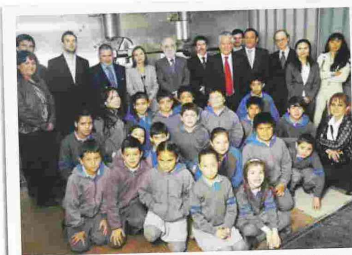
Los alumnos del Liceo Marqués de Ovando junto a sus profesores y las autoridades presentes en la actividad