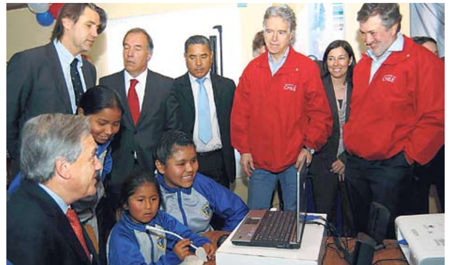
El Presidente Sebastián Piñera valoró la importancia del proyecto.