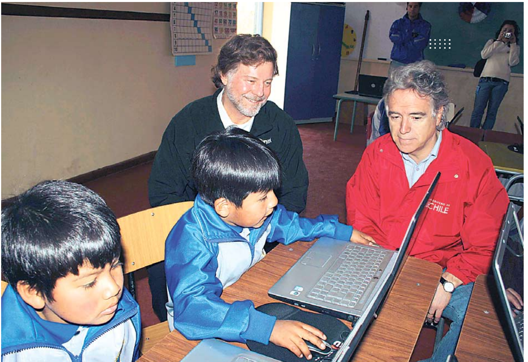
La Banda Ancha Móvil es un gran impulso para la educación de niños de zonas rurales.