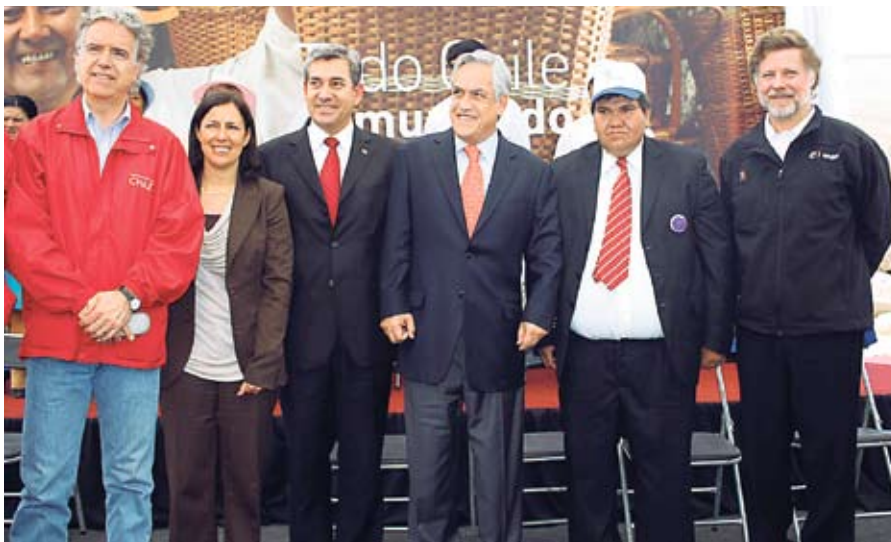
La inauguración de la primera etapa fue en el Valle de Chaca.