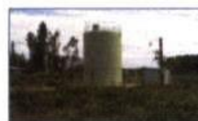
COLTAUCO MB 530 – AÑO 2001

Más de 300 Plantas en el mundo y 8 Plantas en Chile. Operan en base a Filtros biológicos con rellenos Filterpack