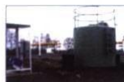
SHELL CHILE MB 400 – AÑO 2002