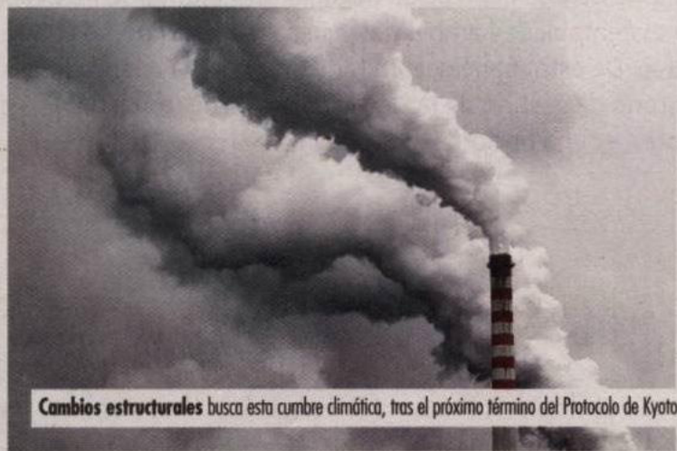
Cambios estructurales busca esta cumbre climática, tras el próximo término del Protocolo de Kyoto.