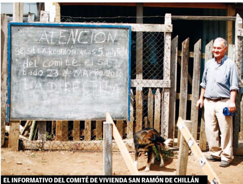
EL INFORMATIVO DEL COMITÉ DE VIVIENDA SAN RAMÓN DE CHILLÁN

Tal como ocurría antaño, cuando no existía ni Facebook, Twitter o teléfonos celulares para comunicarse, así viven en la actualidad un grupo de vecino del sector El Saque de Chillán. Víctimas de las precarias condiciones de vida y sin contar con servicios básicos, deben volver al pasado para comunicar sus reuniones.