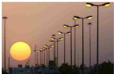
"Pacto Global reconoce que las ciudades tienen un papel muy importante que desempeñar en la creación de un futuro sostenible".