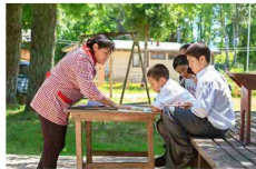
Desde hace 25 años, la tarea principal de la fundación ha consistido en acompañar y fortalecer el trabajo de los docentes.

Educacional Arauco ha consistido en acompañar y fortalecer el trabajo de los docentes de las escuelas municipales a las que asisten, habitualmente, los niños con mayor vulnerabilidad. Para realizar esta labor ha generado importantes alianzas con otras instituciones y ha logrado involucrar directamente con las comunidades donde la empresa tiene presencia industrial y forestal. "Sabemos lo importante que es incluir a la comunidad en la labor de mejorar la calidad de la educación. Es por esto que trabajamos en terreno con todos los escuelas municipales de una comuna, lo que nos ha permitido conocer mejor las necesidades y los desafíos de los profesores y generar un compromiso tanto de las autoridades como de los docentes, alumnos, apoderados y la comunidad en general". De esta forma, la fundación realiza acciones en terreno, lo que permite un trabajo permanente con los profesores en sus propias escuelas; desarrolla investigación