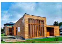
En dos años se han puesto en marcha los centros de San José de la Mariquina, Constitución y Curanilahue.

organización independiente, la Fundación Acercaredes, que impulsará una red de "hubs", espacios diseñados para el trabajo y la conectividad, localizados en territorios alejados de los principales centros urbanos. Hoy, Acercaredes es un emprendimiento basado en la asociatividad entre emprendedores locales y organismos técnicos, productivos, gremiales, culturales, académicos, corporativos y comerciales de las comunas, las regiones y el país. Esto le ha permitido impulsar sus primeros tres centros en San José de la Mariquina, Curanilahue y Constitución. El modelo considera a socios sostenidores (que financian y son aquellos con fuerte presencia en la zona); "programáticos" (que ayudan a configurar espacios de actividades); "locales" (aportan recursos para toda la red). Entre los socios que se han hecho parte de este desarrollo, Acercaredes se encuentran VTR, Transcel, Telefonía del