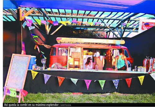
Así queda la combi en su máximo esplendor