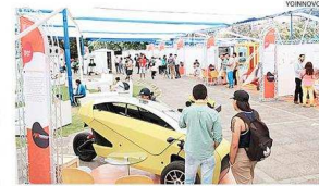
LA FERIA SE REALIZÓ LA SEMANA PASADA EN LA U. DE SANTIAGO.

También destacó entre los visitantes una empresa nacional que transforma vehículos convencionales a eléctricos y una aplicación que permite reservar estacionamientos desde el celu-