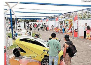
LA FERIA SE REALIZÓ EN LA UNIVERSIDAD DE SANTIAGO.

Este año, el Instituto Nacional de Propiedad Industrial (INAPI) destacó a la Universidad de