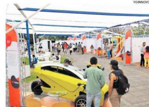
LA FERIA SE REALIZÓ LA SEMANA PASADA EN LA U. DE SANTIAGO.

Este año, el Instituto Nacional de Propiedad Industrial (INAPI) destacó a la Universidad de