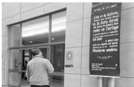
Imagen del día