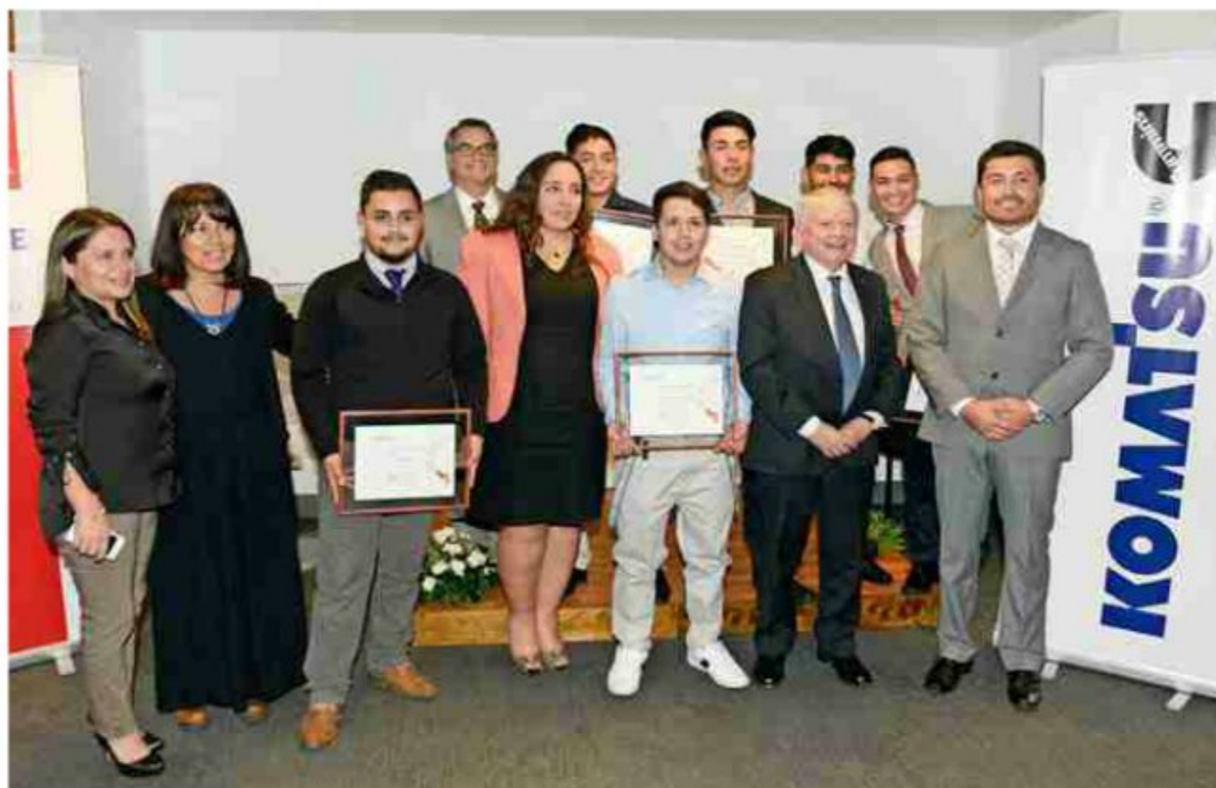
La Fundación Reinventarse ha capacitado, a la fecha, a más de setenta jóvenes.

Acompañados por colaboradores de la empresa, a través del programa de Padrinos Reinventarse, estos jóvenes reciben durante los diez meses que dura el programa, un sueldo y beneficios como aguinaldo y caja de mercadería para Fiestas Patrias y Navidad; bono de desempeño mensual, bono de movilización por día asistido, almuerzo y actividades de extensión. Luego, la compañía ofrece prácticas laborales y, posteriormente, la