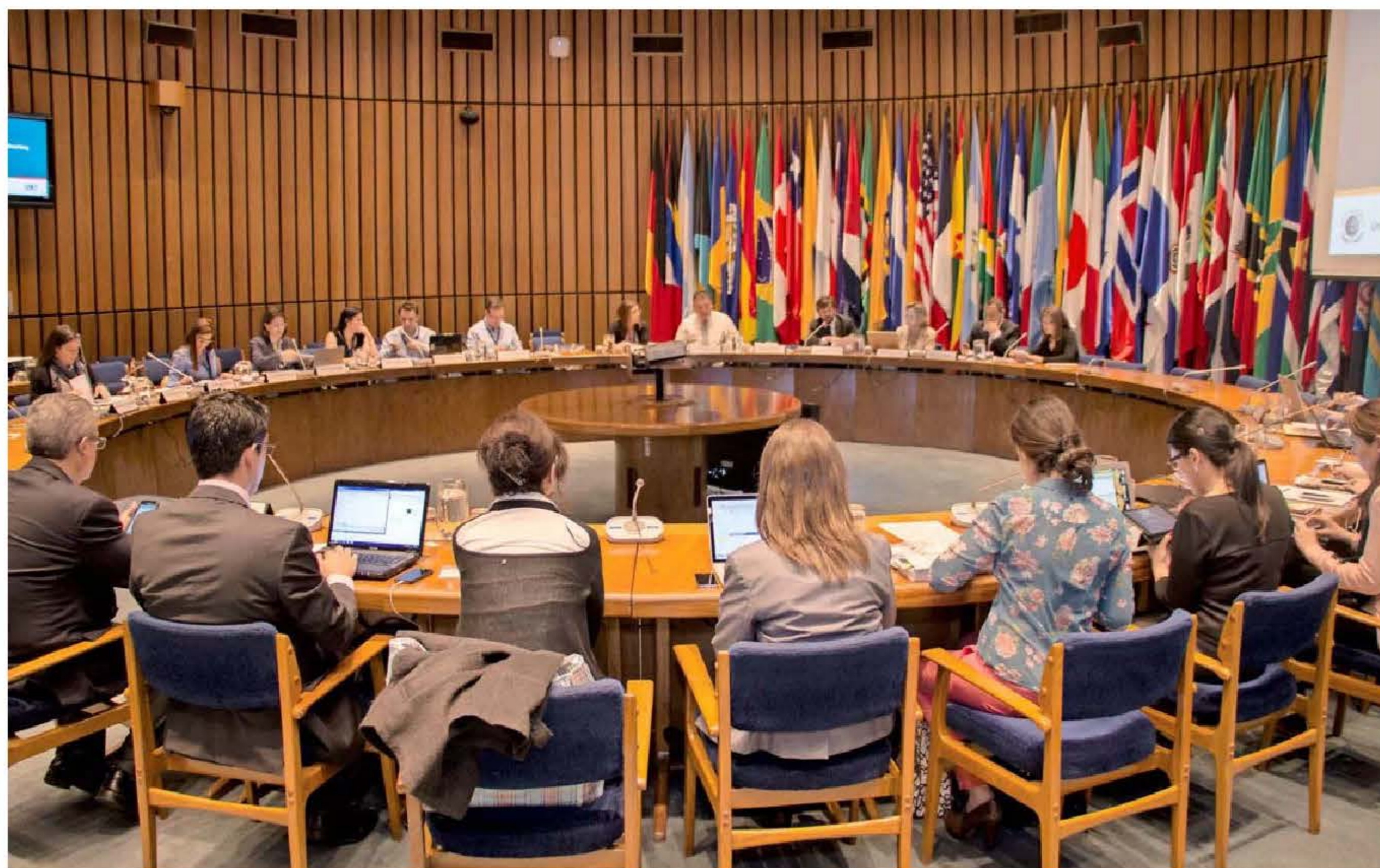
Encuentro Regional de Redes Locales de Pacto Global, 2015. CEPAL, Santiago, Chile.

19 países latinoamericanos han alineado sus planes nacionales de desarrollo a la nueva agenda global de Naciones Unidas.