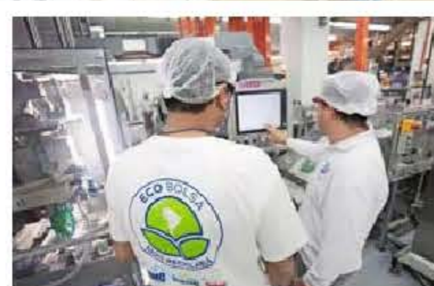
Arriba: la primera villa sustentable. Abajo: producción de detergentes sustentables.

Gracias a esto, en un año, se dejan de emitir 7.800 toneladas